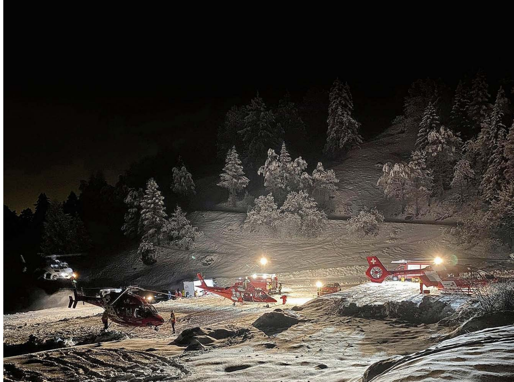
Bis zu neun Rettungshelikopter und ein Super-Puma der Armee standen ab Sonntag im Einsatz.

An der Bertolihütte kamen die verunglückten Skitourengehänger nie vorbei, wie Schenk bestätigt. Am Samstag hatte sich ein besorgtes Familienmitglied bei ihr gemeldet und nachgefragt, weil die Verwandten nicht wie geplant in Arolla eingetroffen waren. Aber: «Wir hatten absolut null Sicht und der Sturm blies mit bis zu 150 Stundenkilometern um die Hütte», so Schenk.